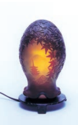
秋色のランプ