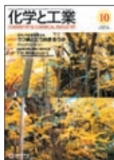
表紙：イチョウの木の写真を題材にして作成